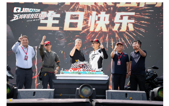
2025 年 5 月 26 日 QJMOTOR 五周年摩友狂欢嘉年华

温岭传媒发展有限公司聚焦政务商务服务，与钱江摩托等知名企业建立长期合作关系，策划执行 QJMOTOR 五周年摩友狂欢嘉年华等活动，打造了媒体服务本地产业的创新样本。温岭广电网络有限公司发挥渠道优势，成为本地最大的监控专网服务运营商，并构建“市镇村户”四级应急广播体系，成为守护群众安全的“数字哨兵”。温岭市大数据发展有限公司稳步推进全省政务集约化运维试点，并推动成立市网络安全运营中心，为全市数字经济发展提供了坚实的安全保障。