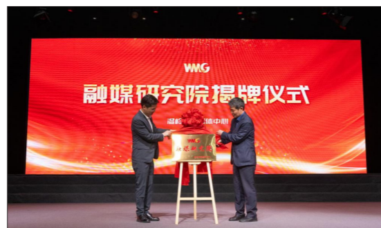
2025 年 4 月 18 日成立全国首家融媒研究院

中心常态化开展政治素质淬炼和业务技能提升各类培训，依托“融媒研究院+融媒学堂+融媒大讲堂+智媒先锋训练营+融媒训练营”五位一体的培育模式，构建全周期人才培养体系。近年来，在全国及省级专业竞赛中获奖超 100 人次，2025 年两人晋升新闻副高职称，三人被聘为浙江传媒学院业界导师。