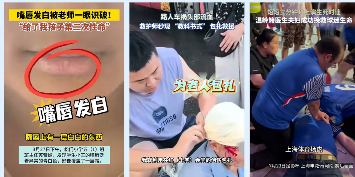
温岭发布视频号在 2025 年 4 月 9 日、1 月 5 日、7 月 25 日推送的正能量短视频

中心构建“双线并行”宣传监督体系。一方面，引导社会热点，深耕正能量报道。全年推出正能量报道 100 余篇，打造多个爆款。其中，《老师多看一眼，救了学生一命》视频上线 48 小时播放量突破 500 万次，话题总阅读量超亿次；《路人车禍头部流血 救护车教科书式包扎救援》《赛场内有人心脏骤停 温岭籍医生夫妻教科书式救援》等短视频同样引发广泛关注，传递了社会正能量。