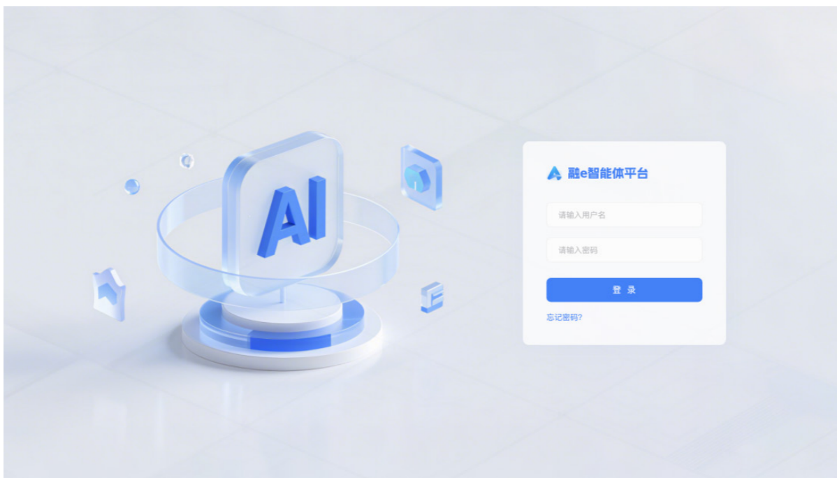
融 E 智能体平台。

中心持续优化融合采编平台，实现“一次采集、多元生成、全媒传播”的工作流程。深化与镇（街道）、部门的内容协作，畅通基层新闻报送渠道。在技术创新方面，完成掌上温岭 APP 多次更新迭代，启动 AI 能力本地化部署，依托自有研发能力搭建本地化部署的融 E 智能体平台，组织 AI 工具应用培训，实现采编线全员掌握基础 AI 工具，重点岗位具备全流程 AI 生产能力。