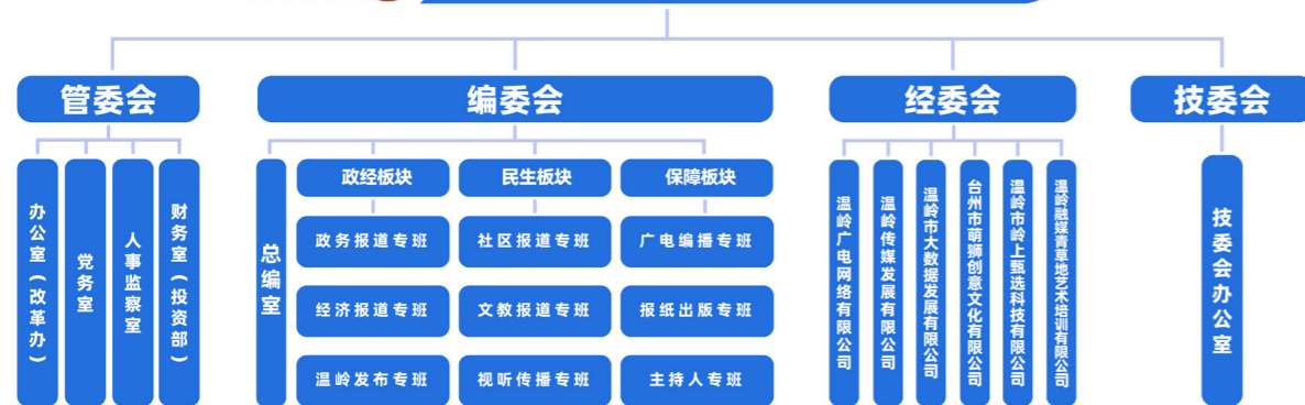
WMG 温岭市融媒体中心(传媒集团)组织架构

温岭市融媒体中心锚定“打造全国一流的县域治理现代化媒介平台”目标，深化改革攻坚、深耕新闻主业、深构产业生态，努力探索县域主流媒体系统性变革温岭模式”。中心（集团）实行“一套人马，两块牌子”运营，推行事企并轨管理，在原有管委会、编委会、经委会基础上增设技委会，以技术赋能新闻主业与产业发展。在采编条线推行专班化改革，持续优化运行机制。2025年，集团营收2.14亿元，实现利润新增长，营收增幅五年来领跑行业前沿。