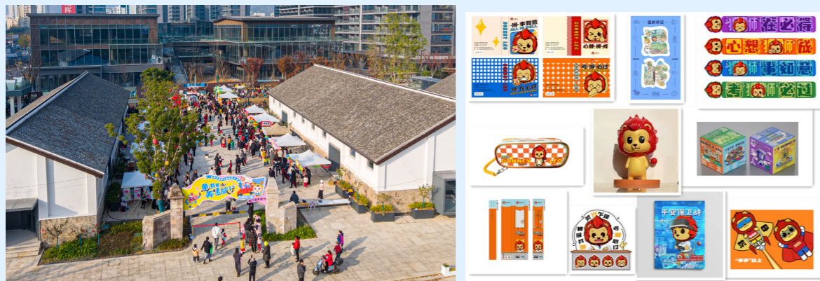
2025 年 3 月 3 日举办月河元宵嘉年华活动；曙光狮周边

挖掘“曙光狮”城市 IP 的文化价值与市场潜力，开发蓝牙音箱、文创礼盒等 10 余款周边产品，通过线上线下销售。推进月河天地文化街区建设，引入本地产业品牌 30 余家，策划举办月河元宵嘉年华等系列文化活动，将月河天地打造成为集文化体验、休闲消费、社交互动于一体的温岭文化新地标。