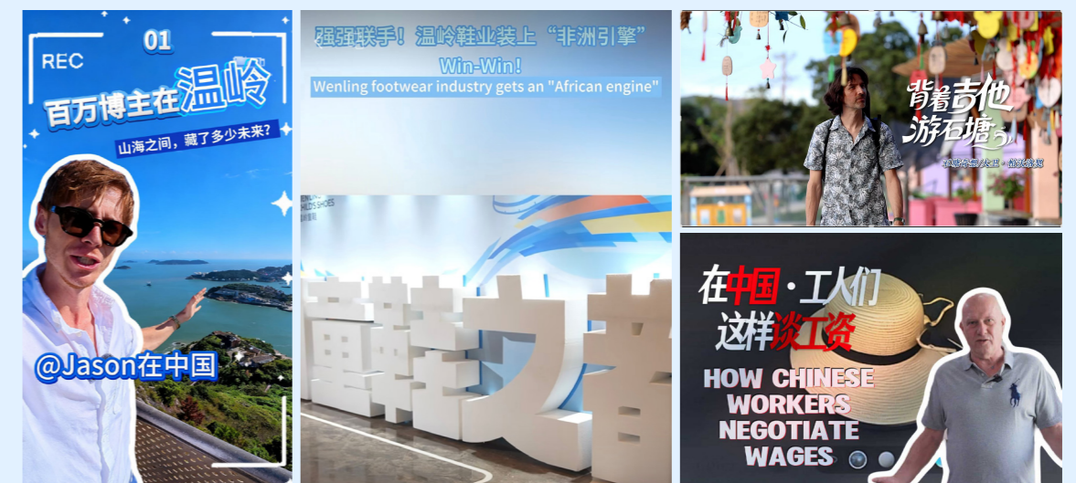
温岭发布视频号 2025 年 11 月 1 日、11 月 20 日、11 月 24 日、9 月 13 日推送的国际传播作品。

中心构建全域传播矩阵，重点运营 Twitter、Facebook、TikTok 等六大海外平台账号，粉丝总量 46.8 万，全年发布帖文超 1.1 万条，推出 15 条百万级爆款内容。聚焦“民企出海”主题，策划推出《温岭制造绝地反击》《温岭鞋业装上非洲引擎》等一系列优质短视频，助力本土企业提升海外知名度、拓宽海外市场。拍摄反映温岭民主恳谈、行业工资协商制度的短视频《在中国工人们这样谈工资》，用真实、鲜活的故事向世界传递温岭的产业活力、文化温度与制度创新，在对外传播中彰显主流媒体的社会责任。