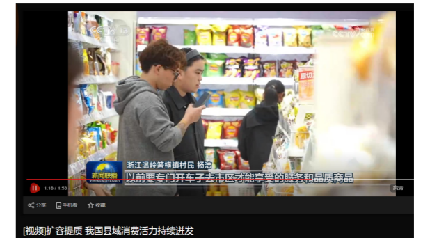
2025 年 12 月 10 日央视《新闻联播》以温岭为重点案例，报道我国县域消费活力持续迸发的经济现状。

中心加强外宣策划，畅通重要选题报送渠道。2025 年，累计在省市外主流媒体上刊播稿件 3500 余条次，其中中央级主流媒体 700 余条次、省级主流媒体 1800 余条次，重磅报道数创历年最好成绩。广播、电视、新媒体外宣协作全部居全省县融前十，其中新媒体协作居全省第二，连续六年保持在领先方阵。