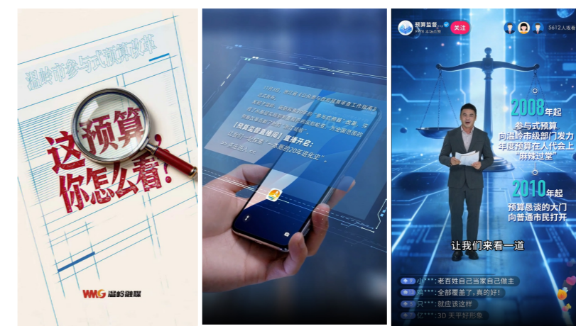
2025 年 11 月 3 日推出数据新闻《这预算，你怎么看？》